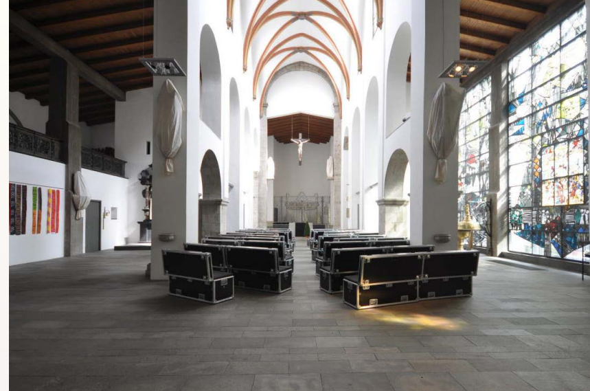
:: Chiesa di San Rocco ad Armeno (Novara, Italia) .

15:00 Discussione e approvazione delle Linee guida per la dismissione e il riuso degli edifici di culto Discussion and approval of Guidelines for the decommissioning and reusing of worship buildings